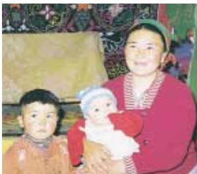
IN SENSO ORARIO: Musulmani della Mongolia, del Marocco, dell'Inghilterra, dell'Egitto, del Pakistan, e della Federazione Russa.