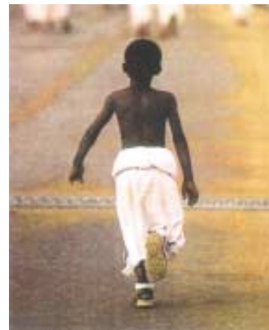
SOPRA: pellegrini in preghiera nella Moschea di Makkah. CENTRO: Tende per i pellegrini. IN BASSO: Un bambino con indosso l'irham (veste composta da due pezzi di stoffa di cotone bianco) segue i pellegrini durante l'Hajj.

e Marwa, come fece Hagar, moglie di Abramo, mentre era alla ricerca dell'acqua per suo figlio Ismaele. Poi i pellegrini si raccolgono nell'ampia spianata di Arafat e si uniscono in preghiera per impetrare il perdono divino, cosa che viene spesso vista come anticipazione del Giudizio Universale. Nei secoli passati, compiere l' Hajj era un'impresa veramente ardua.