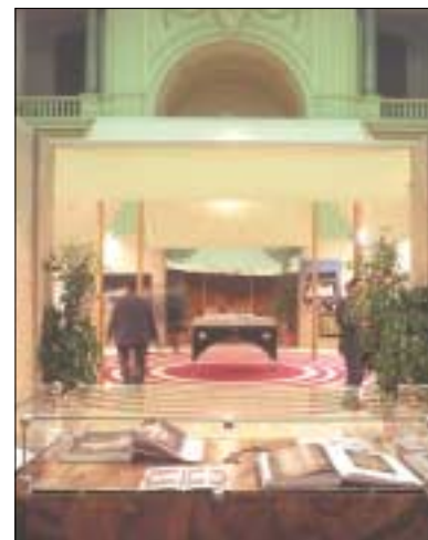
NELLA PAGINA ACCANTO: Il Centro Islamico Culturale d'Italia a Roma. IN ALTO: Viale della Moschea. SOPRA: Interno della Mostra "Scoprire il Pellegrinaggio nell'Islam in cammino con Abramo", Pontificia Università Gregoriana, Roma.