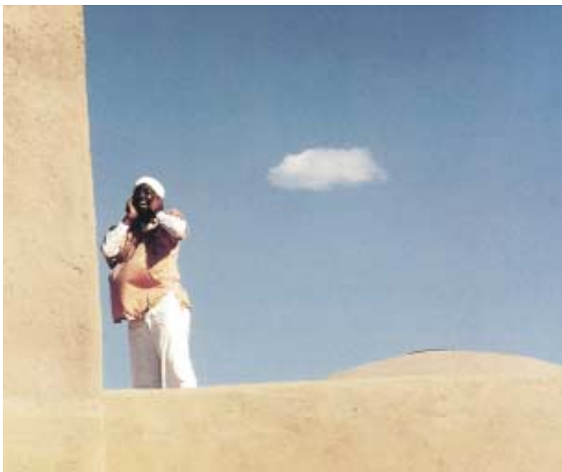
SOPRA: Nuovo Messico, U.S.A, Convocazione alla preghiera, Moschea di Abiquiu.

Una traduzione della Convocazione alla Preghiera: