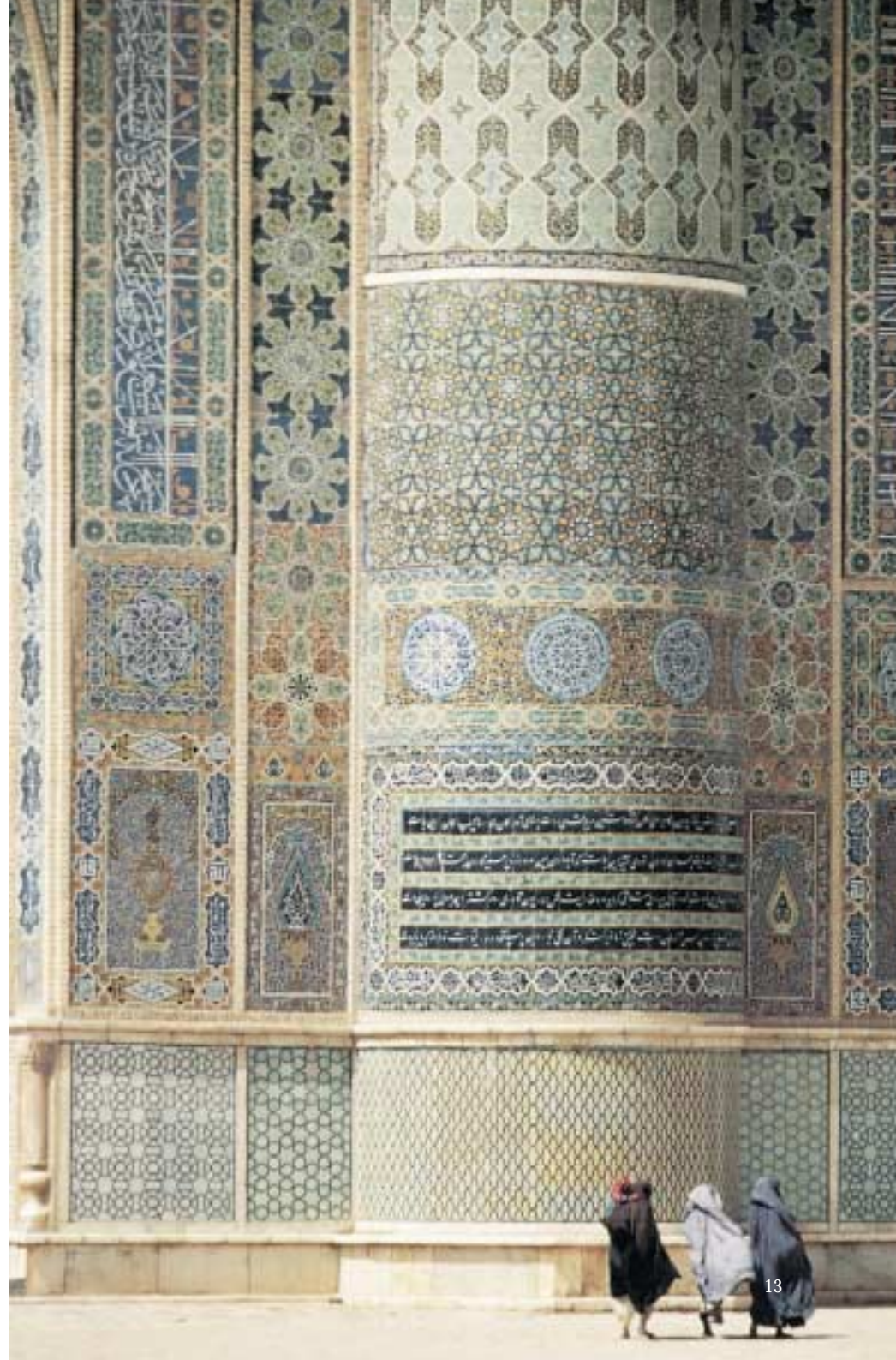
A DESTRA: Cortile della Grande Moschea, Herat, Afghanistan.

Allah è grande, Allah è grande. Allah è grande, Allah è grande. Testimonio che non vi è altro dio che Allah Testimonio che non vi è altro dio che Allah Testimonio che Muhammad è il messaggero di Allah. Testimonio che Muhammad è il messaggero di Allah. Venite alla preghiera! Venite alla preghiera! Venite al successo! ( in questa vita e nell'al di là) Venite al successo! Allah è grande, Allah è grande. Non vi è altro dio che Allah.